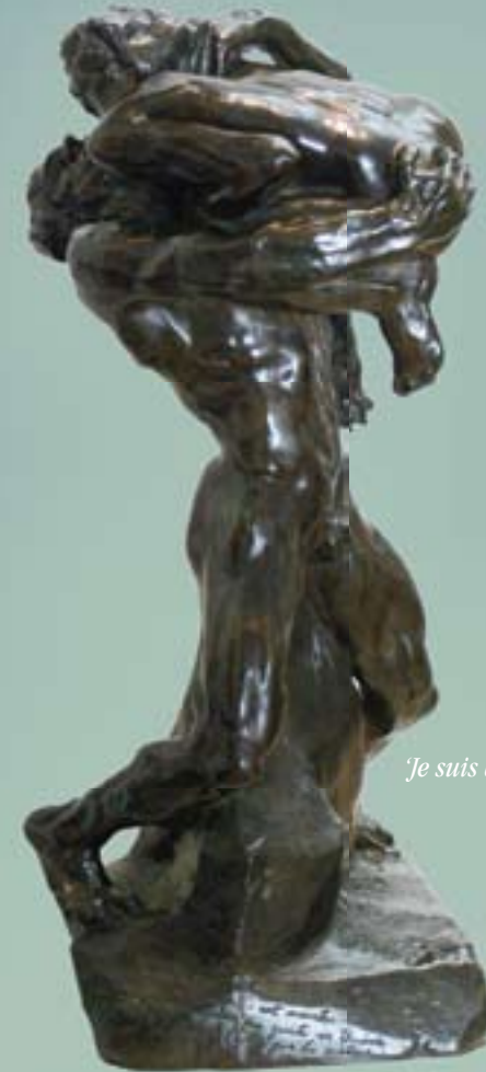
'Je suis belle' (Rodin)

Contact U kunt direct telefonisch contact opnemen met één van ons. Voor algemene vragen kunt u ook mailen naar info@rienvanderzeijden.nl